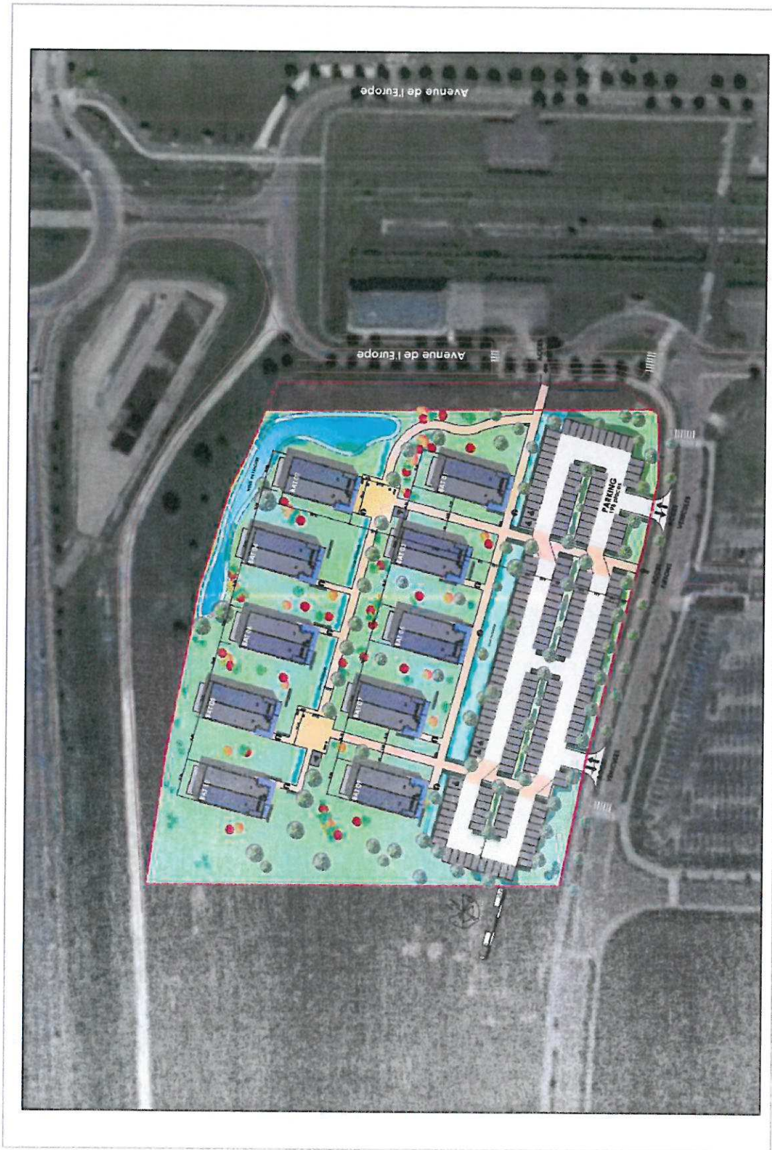
Plan de masse du projet : insertion aérienne