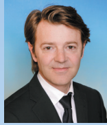
François BAROIN (M)