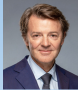
François BAROIN (M)