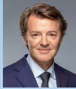
François BAROIN (M)